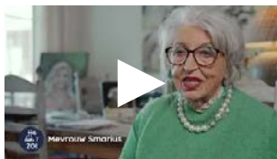
Mevrouw Smarius over de medicijndispenser