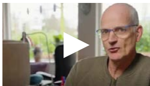
Zoon Koen over samen zorgen

Gebruik ze in gesprek met cliënten en naasten!