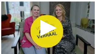
Medewerker en mantelzorg over samen zorgen