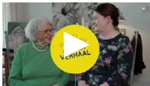
Langer zelfstandig met de medicijndispenser