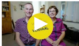
Zorg- en welzijnsmedewerker over samen zorgen