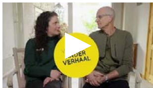
Medewerker en mantelzorg over samen zorgen