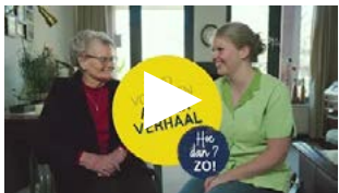
Langer zelfstandig met Langer Actief Thuis (LAT)