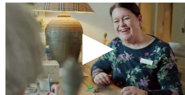
Tip van Vera over de medicijn dispenser