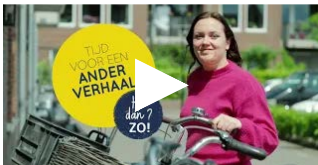
Tip van Charlotte over het innovatieve hoeslaken