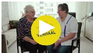
Langer zelfstandig met de druppelbril