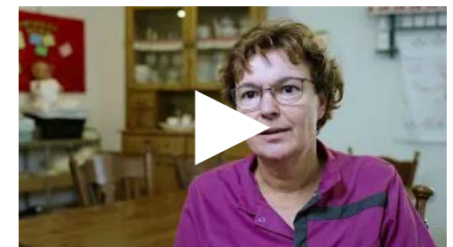
Tips van collega's over samen zorgen: hoe doe je dat met naasten?