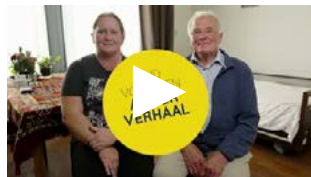
Medewerker en mantelzorg over samen zorgen