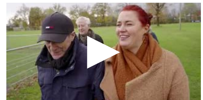
Tips van collega's over samen zorgen: leren van elkaar