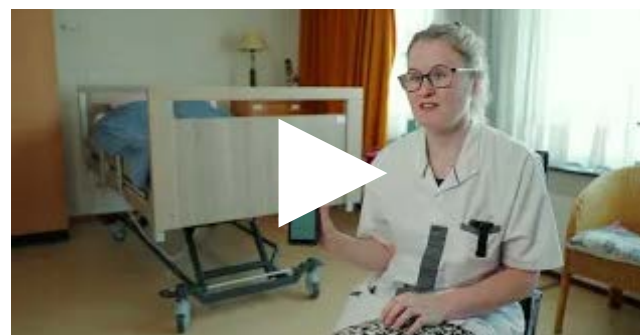
Tip van Eline over de innovatieve bedsensor