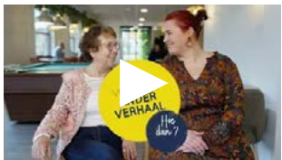
Medewerker en mantelzorg over samen zorgen