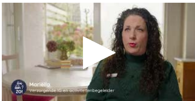
Tip van Mariëlla over samen zorgen