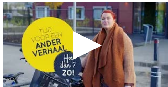
Tip van Estelle over samen zorgen