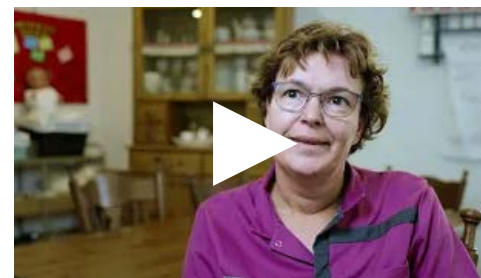
Tip van Silvia over samen zorgen